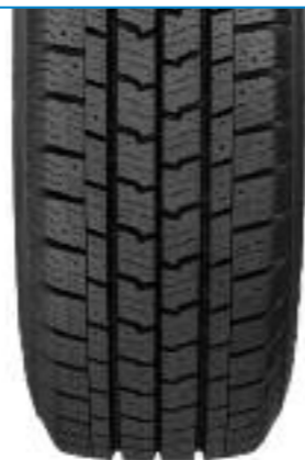
Cargo UltraGrip 2

Маркираната със „снежинка“ Cargo UltraGrip отговаря на изискванията за управление в тежки зимни условия, в съответствие с изискванията на тестовите процедури ETRTO.