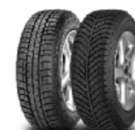
Отляво надясно Eagle Vector EV-2+ Vector 4Seasons