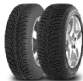
Отляво надясно UltraGrip 6 UltraGrip 7+

Отговорът е гамата от стандартни зимни гуми на Goodyear, подходящи за автомобили, движещи се с максимална скорост до 190 км/ч.