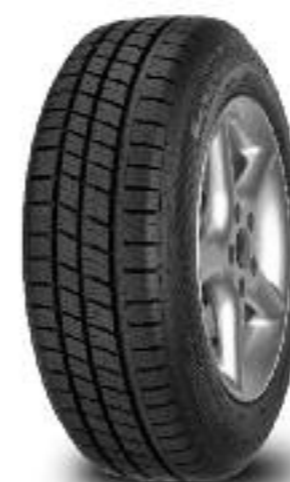
Cargo Vector 2