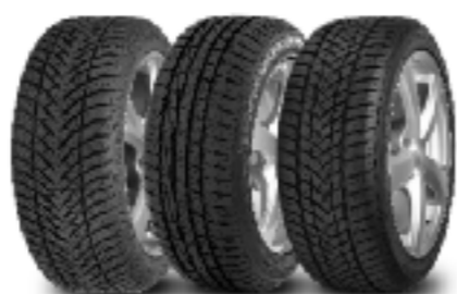
Отляво надясно Eagle UltraGrip GW-3 UltraGrip Performance UltraGrip Performance 2

Goodyear разработи зимни гуми, които са специално проектирани за мощни автомобили, достигащи скорости до 240 км/ч.